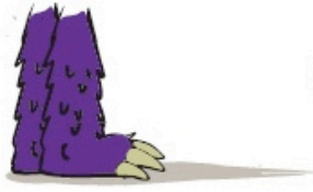
Se tapir légèrement (Slight Cowering)