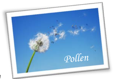
Tableau 1: L'addition des allergies